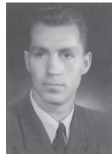
Kazys Petkevičius – 1956 m. olimpijų žaidynių prizininkas, 1953 m. Europos čempionas ir 1955 m. Europos čempionato prizininkas.