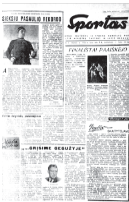
„Sporto“ laikraščio pirmasis numeris.