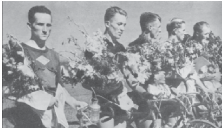
1954 m. lenktynių "Aplink Lietuvą" nugalėtojai.