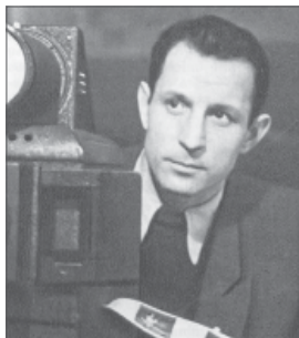
Justinas Lagunavičius – 1953 m. Europos čempionas.